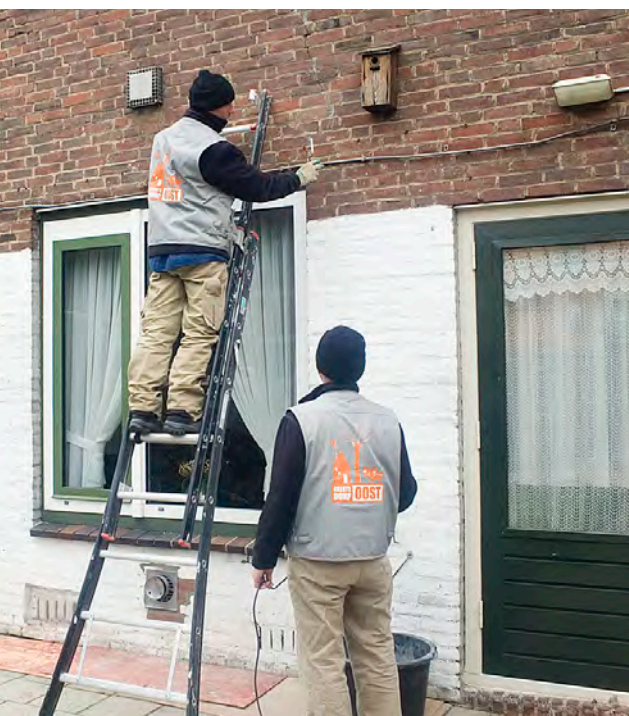
Vakmannen van Ballast Nedam, mét herkenbare bodywarmers.